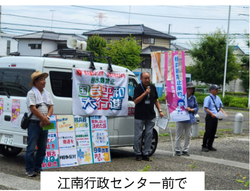
江南行政センター前で