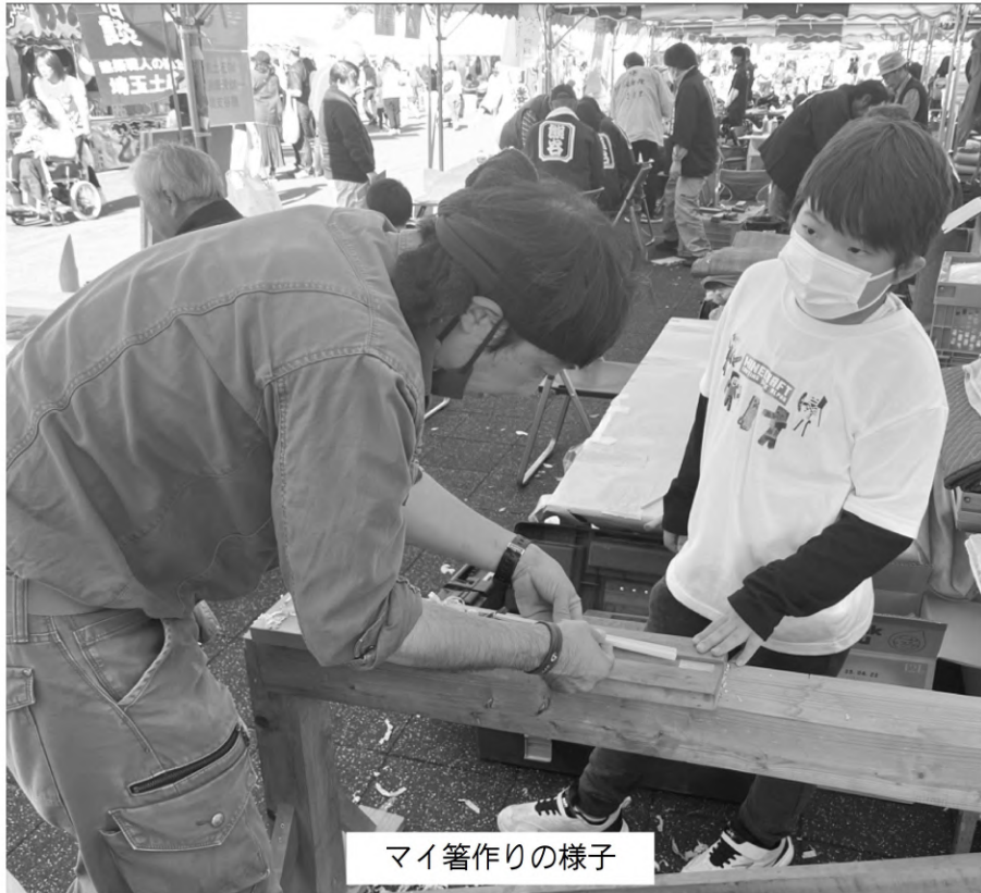
マイ箸作りの様子