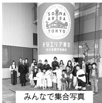
みんなで集合写真

親子で防災意識を持た、いい学習となりました。次回も親子で楽しめる行事を企画できればと思います。