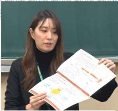
こくみん共済COOPから担当者が説明

1月から共済第二推進期間が始まり、1月22日(水)19時から富士見公民館で全分会から18人が参加し、制度を学ぼうと「どけん共済会推進学習会議」が行われました。