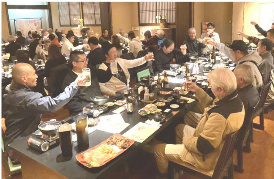
次世代の仲間が多く参加し活気に満ち溢れた旗びらき