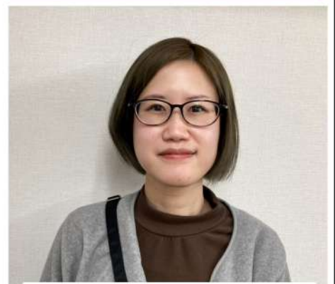
元気で明るい書記局です