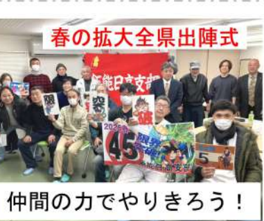
仲間のでやりきろう!

2月1日(土) 19時から本部と支部事務所をWEBで繋ぎ「春の拡大全県決起集会」が行われました。全県から621人、支部から5分会19人が参加しました。