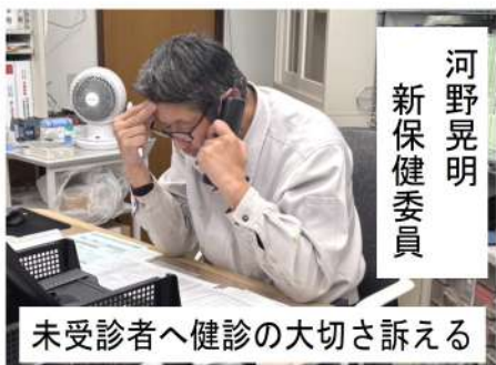
未受診者へ健診の大切さ訴える