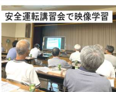
安全運転講習会で映像学習

7月17日（水）19時から富士見公民館集会室で「共済推進委員会」が行われ、関東自動車共済の安全運転講習会と、どけん共済会の火災・地震共済の制度説明が行われました。