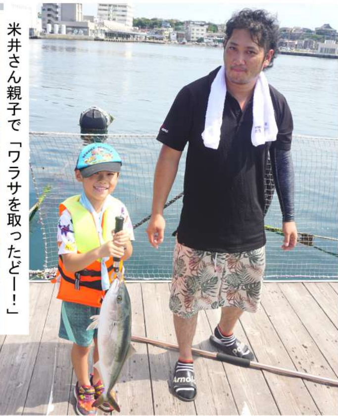
米井さん親子で「ワラサを取ったどー!」

参加者から「柵があるので、子どもを安心して遊ばせられる」「従業員が親切で教えてくれたり、手伝ってくれた」「釣れなくても近くに三崎漁港があるの