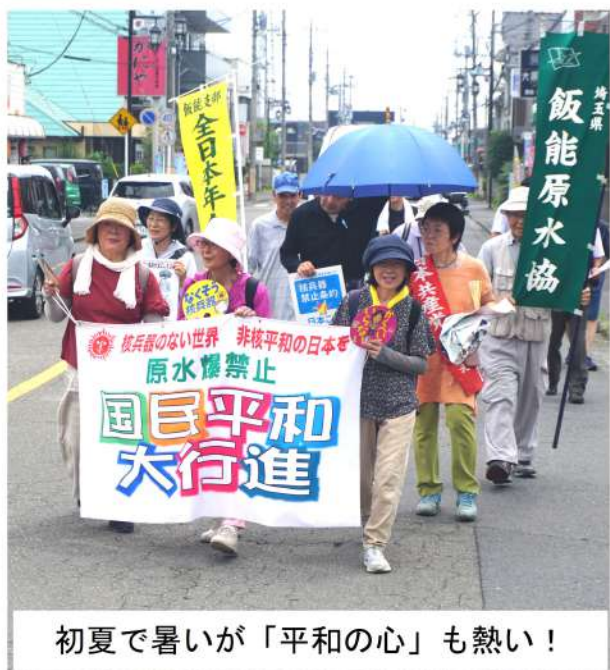
初夏で暑い「平和の心」も熱い！

飯能市は9日（火）10時から飯能市役所に30人が集合し、飯能市内を「戦争反対」とシュプレヒコールをしながら行進を行いました。