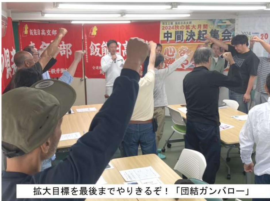
拡大目標を最後までやりきるぞ! 「団結ガンバロー」