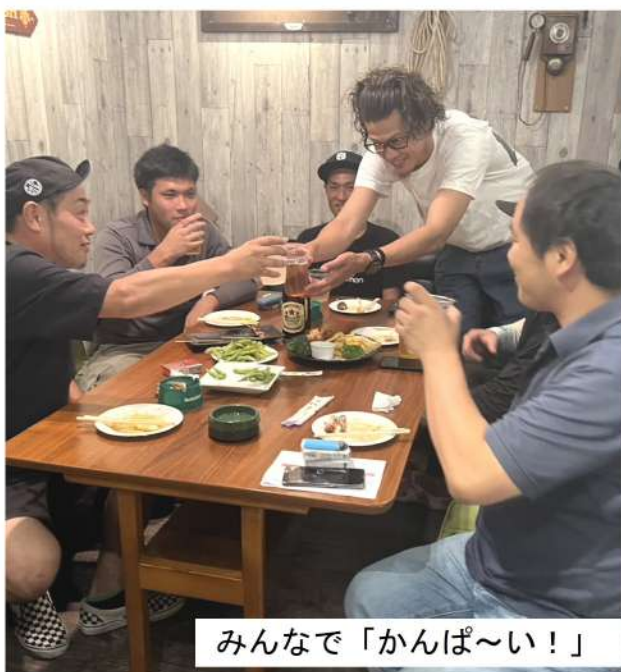
みんなで「かんぱ〜い!」

9月27日(金) 17時半から18時まで飯能駅北口で「消費税減税、インボイス制度廃止宣伝」を5人が参加しティッシュ