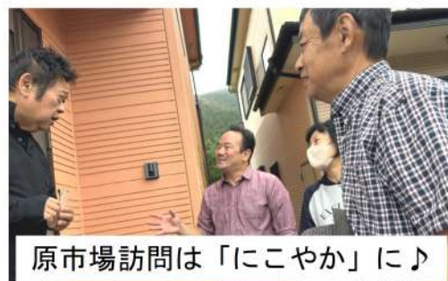
原市場訪問は「にこやか」に♪