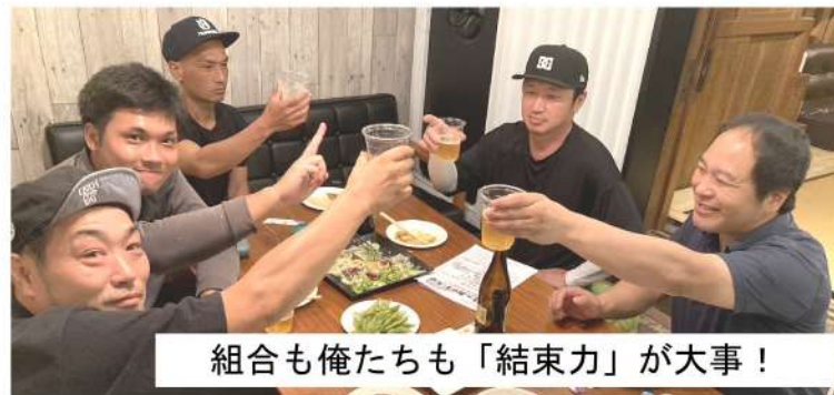
組合も俺たちも「結束力」が大事!

9月7日(土) 19時半から飯能市の「焼き鳥 Dining(ダイニング)高」で9人が参加し「次世代役員&青年部交流会」を行いました。