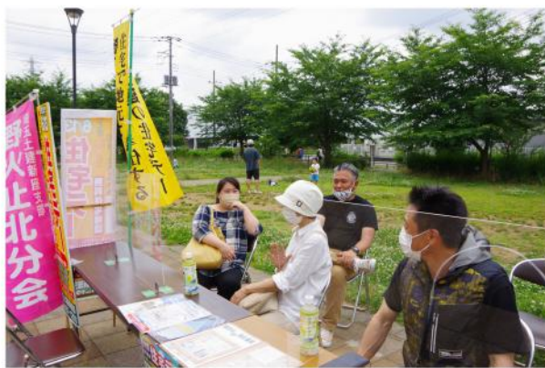
ふるさと新座館前で呼び込み

例年、場所柄広場では、沢山の子ども達で遊んでおり、新座館内で野菜を売っている事もあり、人通りもまあまありましたが、今年の子ども達は遊んでおらず、人影もまばらでした。 野火止北分会の作戦としては、ポップコーン、わたあめで子どもを呼び込み、その親御さんを引き入れる。という事がここ数年続いていたので、今年も それが出来ず、また2時間という制限も有る事から、机を並べての住宅相談にしました。その結果、来客はまたま通りかかった組合員さんのお母様の1名でした。 やはりこのタイミングでの住宅デーは時期尚早だったのではないのでしょうか。「土建さん頑張っているな」よ、「こんな時に土建さん何をやっているのか」と見られていないか。