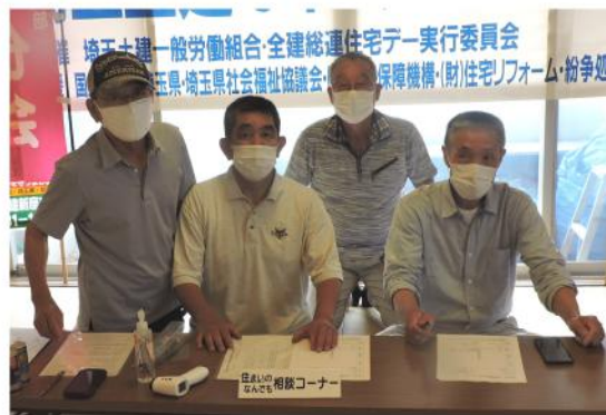
片山集会所で電話相談会

にチラシ350枚各班にて既に配布が終わっており、当日をまっぴらにしましたが、今回の住宅デーにつきまして、コロナ感染のため蔓延防止が延長され、住宅デーも感染に伴い、半日行動となり、極限に縮小された形になり、特に集会所においては、当日社会福祉協議会片山支部が同じ会場を使用しており、分会としても大きく動かせません。