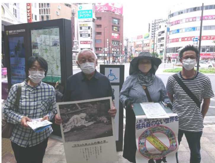
市議も駆けつけ、平和宣伝

今年の世界大会をオンライン開催で行います。当日の大会の様子はYOUTUBE等でアップされる予定ですので、ぜひ皆さんもご覧下さい！