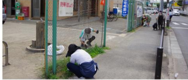
地域奉仕で草むしり