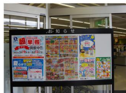
いなげやにチラシが！