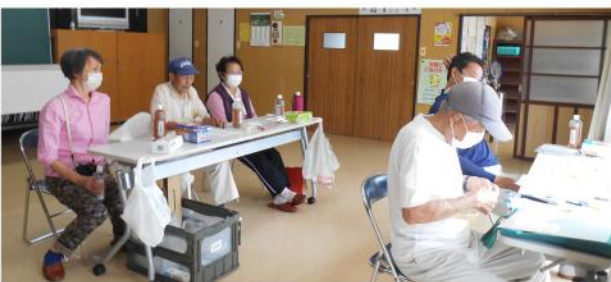
相談が出来る体制を整え

道行く人はまばらで、「住宅相談やっています」と声を掛けたりしましたが、相談者は訪れず、静かに時間が過ぎて行きました。