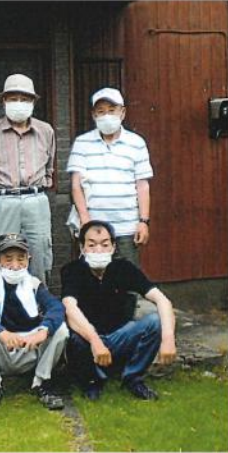
来年こそは盛り上げて成功を！

今年はコロナウイルスに万全の対策を取りながら開催されました。コロナウイルスの影響により、時間を短縮しての開催となりました。