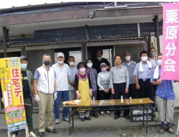
久しぶりに仲間があつまり

来場者3人と淋しく感じましたが、来年はぜひ以前の様な住宅デーが開催され、仲間と協力して成功させようと思いを統一して終了しました。