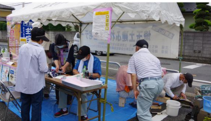
いなげや前で来場者も多く

さる6月13日、ふるさと新座館前の広場に、9名の参加で野火止北分会の住宅デーが行われました。